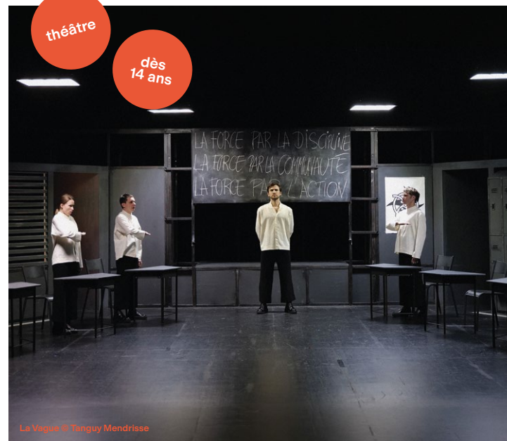
La Vague © Tanguy Mendrisse