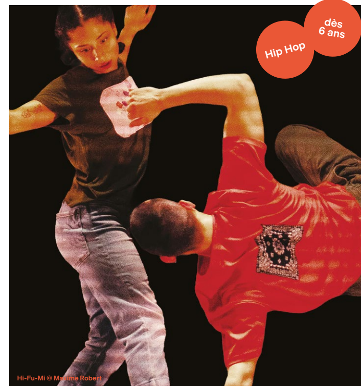
Hi-Fu-Mi © Maxime Robert

Atelier initiation au Hip Hop par la compagnie à 17h