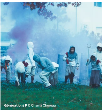
Génération F