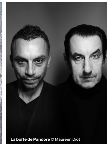
La boîte de Pandore