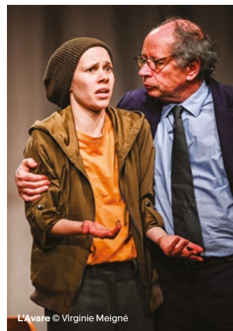
L'Avare © Virginie Meigné